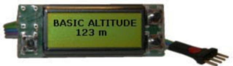
Detalle del conector

Debe ser fácil y rápido el acceso al Altímetro o disponer de un conector hembra de cuatro pines en el fuselaje igual al que incorpora el Altímetro.