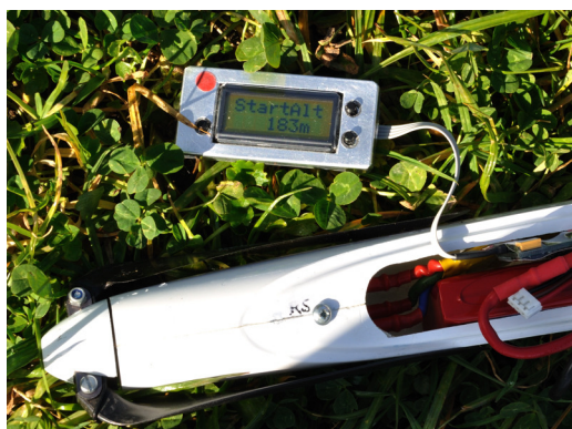
Forma de Lectura